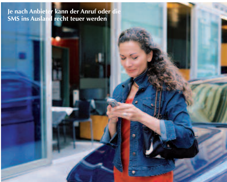
Je nach Anbieter kann der Anruf oder die SMS ins Ausland recht teuer werden

Beim gelegentlichen Anruf in Deutschland bietet Yoigo gegenüber seinen Mitbewerbern unter Umständen einen deutlich günstigeren Tarif. Zwei Minuten Plaudern mit Freunden in der Heimat kosten inklusive Verbindungsaufbau (12 Cent) 72 Cent. Dagegen sehen Movistar (1,33 Euro ins Festnetz, 1,49 auf Handy), Vodafone (1,05 Euro von 22-8 Uhr, 1,35 Euro von 8-22 Uhr), Orange (1,33 Euro von 22-8 Uhr, 1,41 Euro von 8-22 Uhr) und auch Eroski Móvil und Pepephone (beide 1,30 Euro) relativ alt aus. Berücksichtigt man hingegen Spezialtarife wie „Mi País“ (Vodafone) fällt der Preis für das 2-Minuten-Gespräch auf bis zu 71 Cent. Kunden, die in den Genuss der Billigtarife kommen möchten, müssen in der Regel für eine Handvoll Euro den Spezialtarif zuerst abonnieren und freischalten lassen.